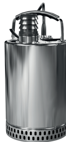
SWQ HOT 750

Pompy zatapialne ze stali nierdzewnej przeznaczone do pompowania wody czystej i lekko zanieczyszczonej, niezawierającej elementów szlifujących (np. piasku). Pompy znajdują zastosowanie do pompowania wód deszczowych i powierzchniowych ze stawów, jezior i rzek, zasilanie oczek wodnych. Odwadnianie zalanych pomieszczeń, domów, garaży i lokali, użytkowanie w gospodarstwach rybnych.